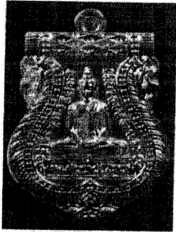
1. เหรียญพระพุทธโสธร เนื้อเงิน

เหรียญพระพุทธโสธร รุ่น "ร่วมจิตต์น้อมเกล้าฯ" ปี 2562 ( ขนาด 2 X 3 ซม. ) มอบแก่ผู้บริจาคเงินสมทบมูลนิธิร่วมจิตต์น้อมเกล้าฯ เพื่อเยาวชน ในพระบรมราชินูปถัมภ์ เพื่อเป็นทุนการศึกษาอบรมอย่างต่อเนื่องแก่เยาวชนผู้ยากไร้ด้อยโอกาสทั่วประเทศ