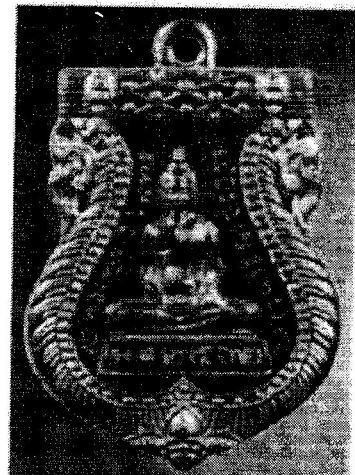
4. เหรียญพระพุทธโสธร เนื้อทองแดงลงยา