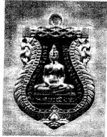
2. เหรียญพระพุทธโสธร เนื้อเงิน