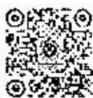
เวบไซต์ สื่อประชาสัมพันธ์

ติดตามข่าวสาร และดาวน์โหลดสื่อประชาสัมพันธ์บนต้นแบบเกี่ยวกับโรคติดต่อฯ โดยแมลงได้รั