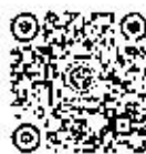
facebook ภูหินโรคแมลง