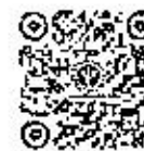
dashboard โรคติดต่อฯ โดยแมลง